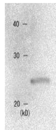
図 2 粗細胞抽出液中の本抗体を用いたウェスタンブロッティング法による HP1 \beta タンパク質の同定 サンプルは MCF7 細胞 抗体は 1,000 倍希釈で用いた (10,000 倍希釈でも可能であった)